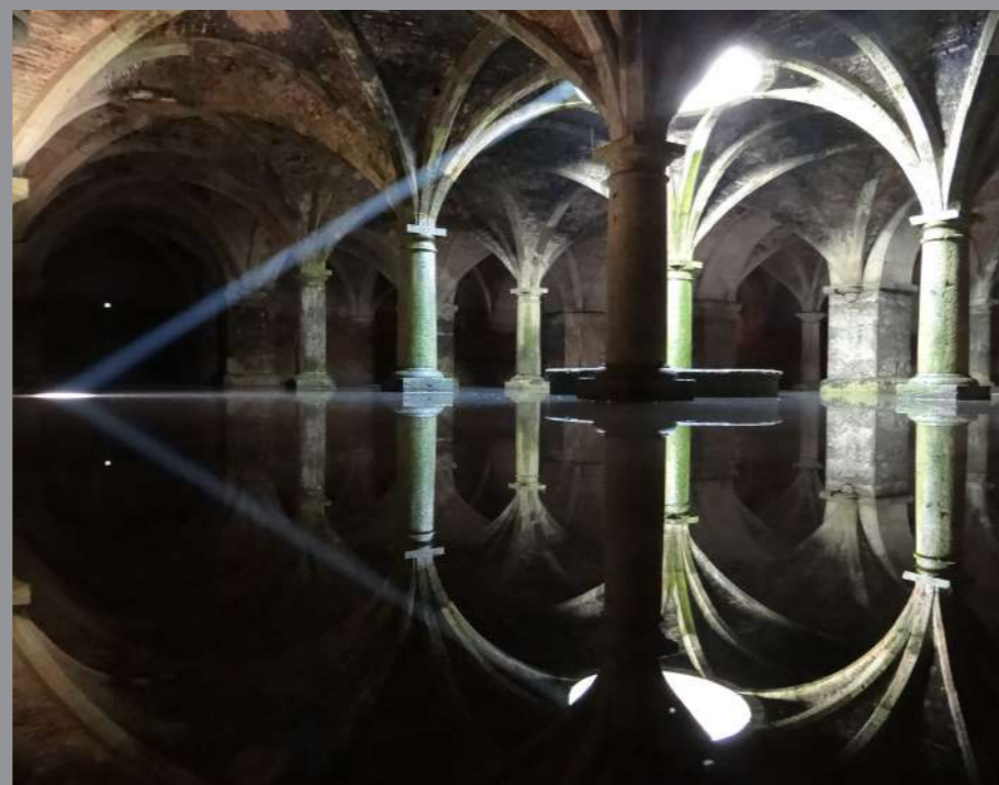
Cisterna Manuelina da Cidadela Portuguesa de Mazagão

A Associação Portuguesa dos Municípios com Centro Histórico, em colaboração com a Embaixada de Portugal em Marrocos, o Ministério da Cultura do Reino de Marrocos, o CHAM - Centro de Humanidades da Universidade Nova de Lisboa e a Commune de Ksar El Kebir, e o apoio de diversas entidades, assinala esta data com a realização de um evento que afirma a figura dos centros históricos luso-marroquinos como um património comum de valor significativo.